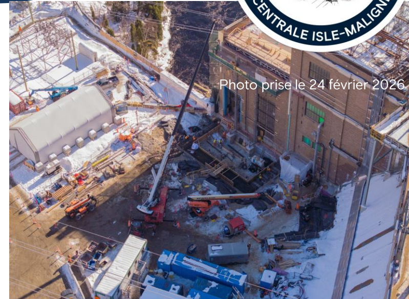
Photo prise le 24 février 2026