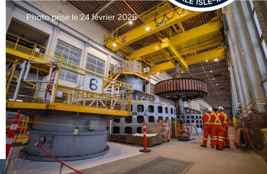
Photo prise le 24 février 2026